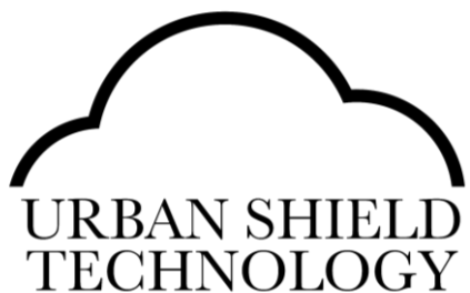
TECHNOLÓGIA URBAN SHIELD